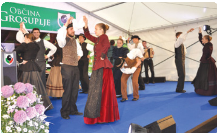
Folklorna skupina Račna