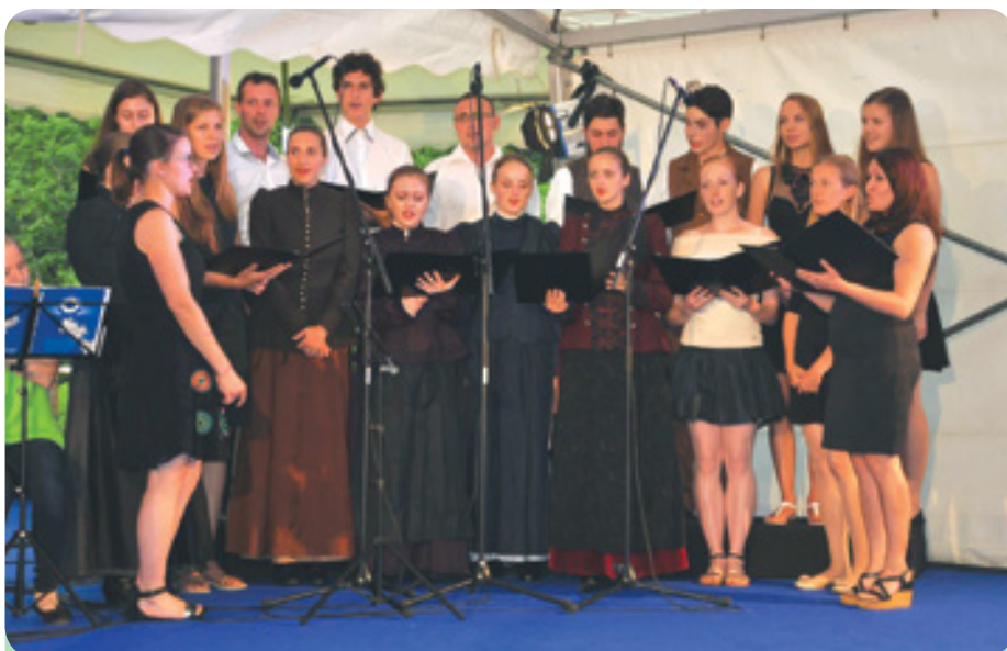
Mladinski pevski zbor Kopanj