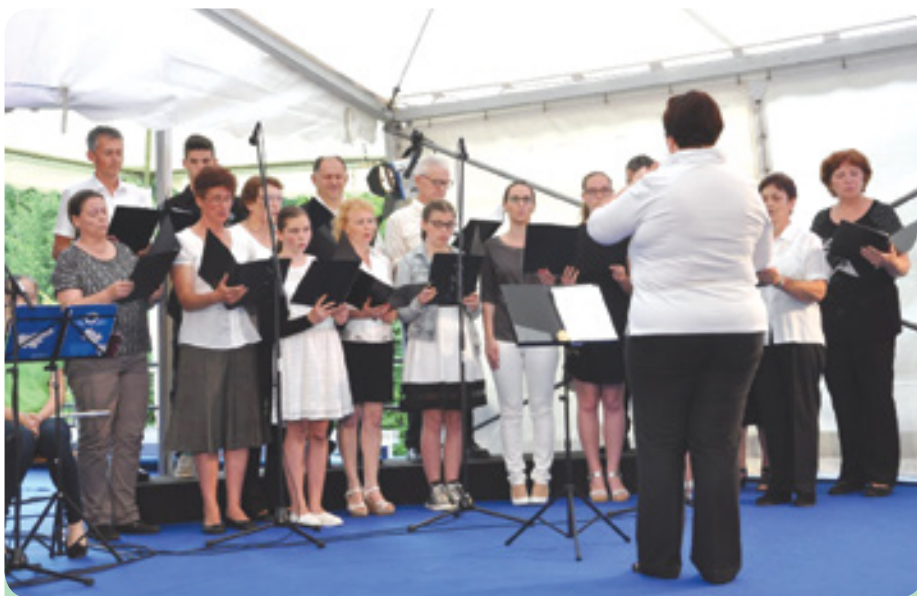
Škocjanski mešani zbor