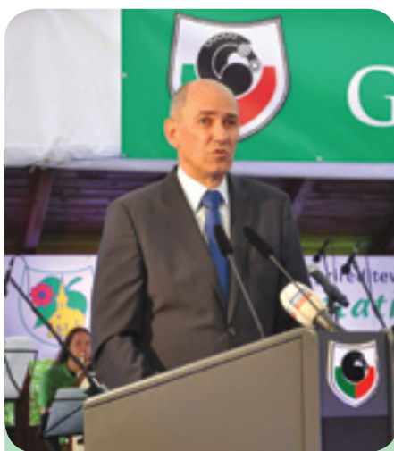
Zbrane je nagovoril poslanec Državnega zbora RS Janez Janša.

Danes se ob 26. rojstnem dnevu slovenske države oziramo nazaj, ne samo v tiste junijske dni pred 26 leti, ampak tudi v vsa ta leta, ki so od takrat minila. V teh 26 letih je zrasla nova generacija Slovenk in Slovencev in v tem času je Slovenija izkoristila mnoge priložnosti, mnogih pa tudi ni. V teh prazničnih dneh se tako mešata ponos in zmagoslavje, pa tudi nekaj pelina. Najbolj grenka kaplja pelina je zagotovo dejstvo, da se je v zadnjih petih letih iz Slovenije izselilo več mladih, kot ima npr. prebivalcev Nova Gorica. Pravzaprav dvakrat toliko. Za samostojno Slovenijo si nismo prizadevali, zanjo glasovali in se branili zato, da bi moral kdorkoli iz Slovenije prisilno odhajati s trebuhom za kruhom. Prav je, da potujemo, da si mladi nabirajo nova znanja povsod po svetu, ampak naj bo to prostovoljno. Naj ne bo to zaradi tega, ker nekdo doma ne dobi dela, ker ne dobi priložnosti. Če bi znali dobro upra-